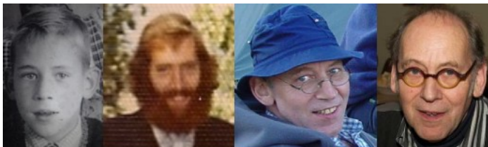
Beelden van het verouderingsproces van een stadsdorper

Een van mijn cliënten, 88 jaar, zei eens, "Elke keer gaat het iets minder of ga je iets achteruit. Het is de kunst om dat te accepteren, je daarop in te stellen en je dan daar vervolgens niks van aan te trekken en vrolijk verder te leven op een manier of je nooit dood zal gaan." Ik vind dat een uitspraak die van veel wijsheid getuigt.