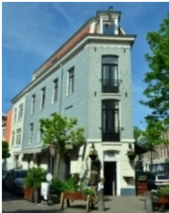
De Punt (kop van de 2e Jacob v Campenstraat)