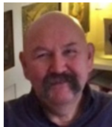
Cor de Bie