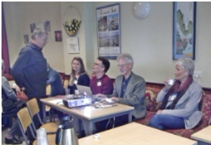
Voorbereiden en proefdraaien op de 2e thema-avond Zorg