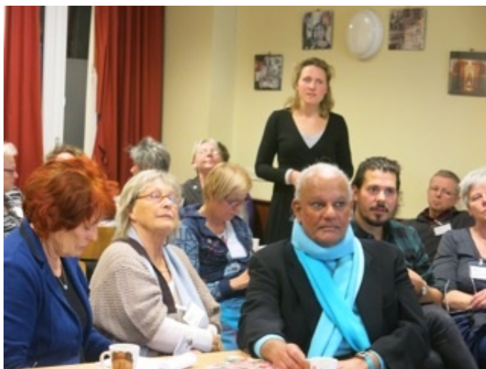
Veel vragen en deskundige antwoorden op de tweede thema-avond Zorg