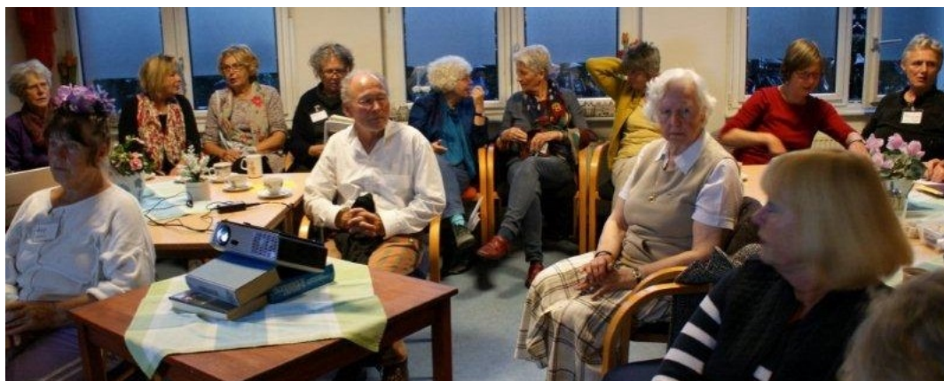
grote belangstelling op de inloop van 30 september