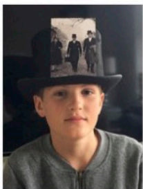
GALERIE COFFEESHOP YO YO 2e Jan van der Heijdenstraat 79 Amsterdam