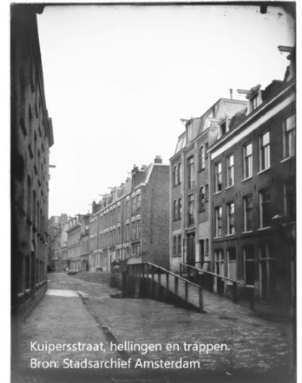
Kuipersstraat, hellingen en trappen.